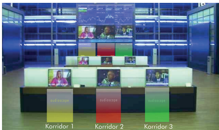
Anwendungsbeispiel: SONUS® audioTrace® in der Neuen Deutschen Börse Frankfurt

Plug and Play Lautsprecher mit umschaltbarer Schallabstrahlung